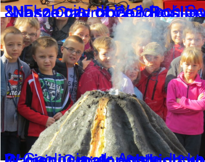
Wizyta w Muzeum Geologicznym w Krakowie