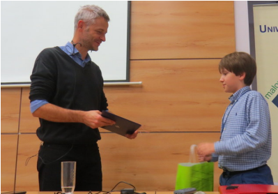
Wizyta w Centrum Edukacji i Promocji Nauki w Krakowie