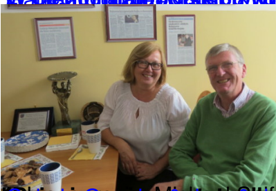
Wizyta w Muzeum Geologicznym w Tybindze, Niemcy