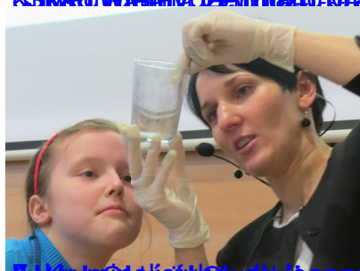
Złota Anna, Katedra Biologii, Polnańska, Uniwersytet Jagielloński w Krakowie