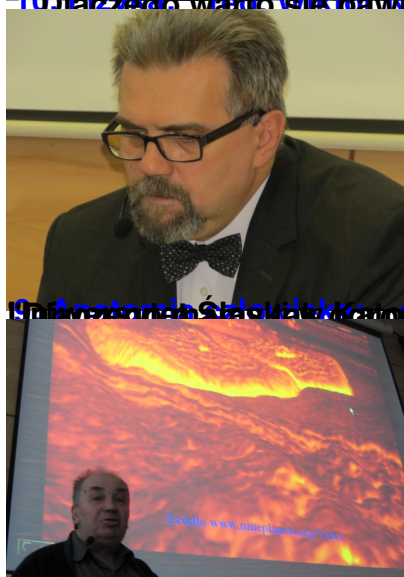
10. Andrzej Boczarowski i Andrzej Boczarowski - Dlaczego nie ma dwóch języków?